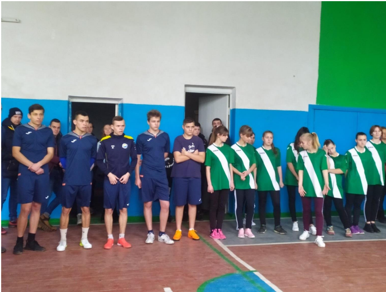
Змагання з волейболу