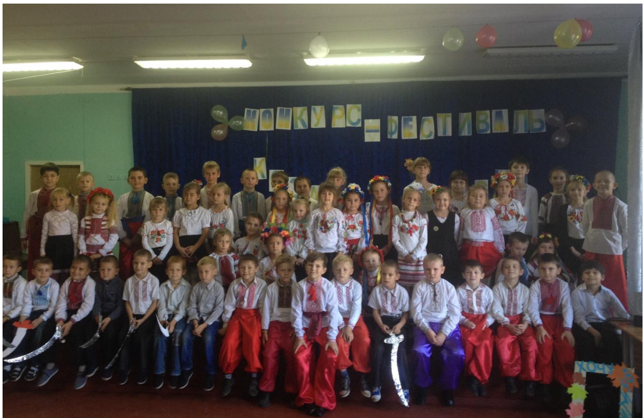
Конкурс-фестиваль «Козацька пісня»