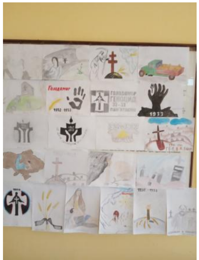
Вшанування жертв Голодомору 1932-1933 років