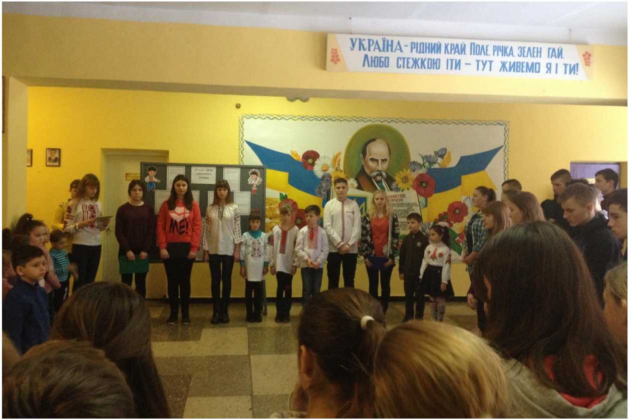
День Соборності України