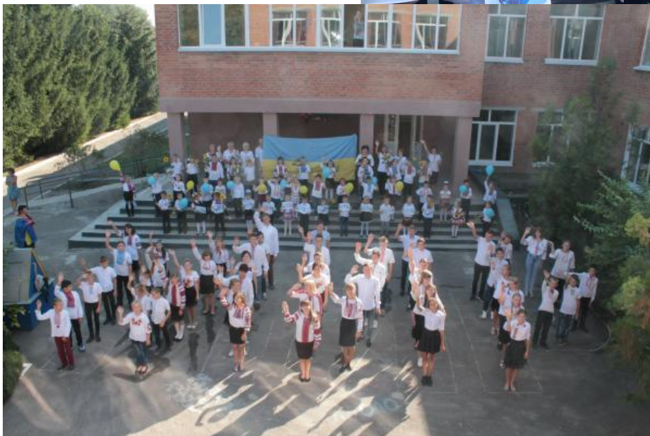
Флешмоб до Міжнародного дня миру