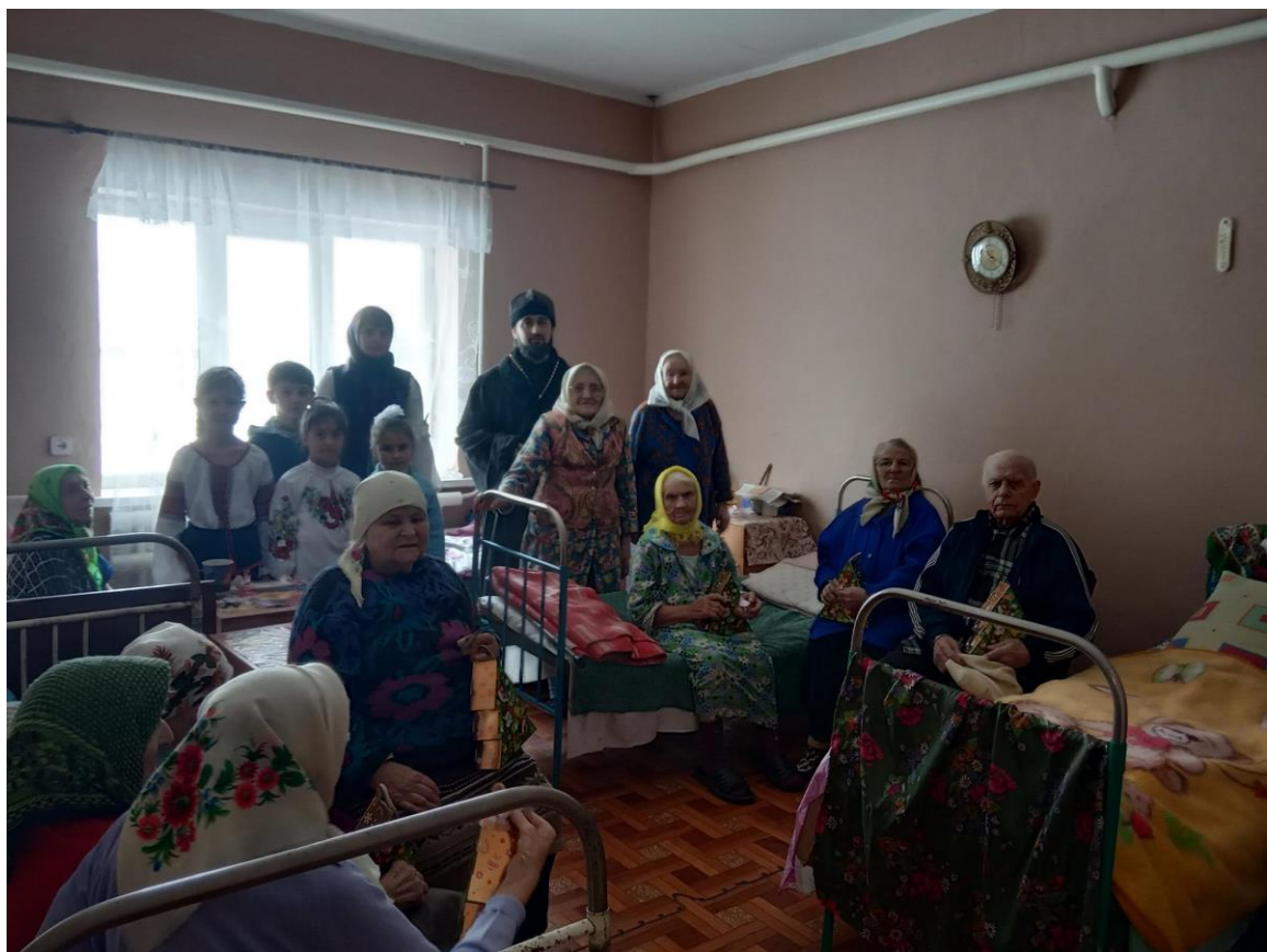
У Будинку ветеранів