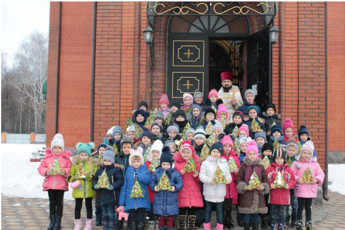
Храм Різдва Богородиці