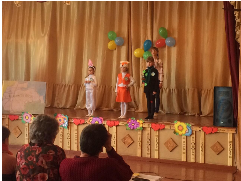
Участь в огляді-конкурсі екологічних агітбригад