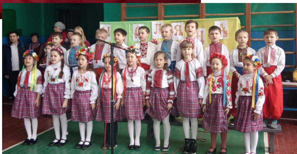
«Масляна прийшла- весну принесла»