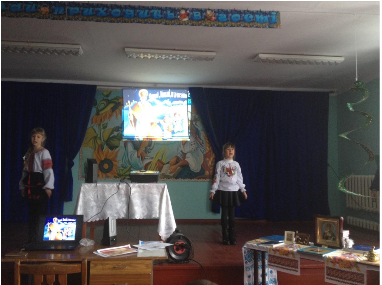
«Святий Миколай, ти до нас завітай»